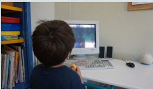
Χρήση υπολογιστή με ειδικό λογισμικό και μέσα διεπαφής

Πέρα από αυτό, είναι οι χώροι μας: Το σχολείο μας βρίσκεται σε έναν θαυμάσιο ελαιώνα, δίπλα από τη