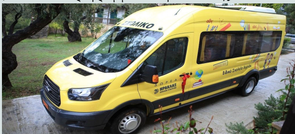
Το σύγχρονο, κλιματιζόμενο, ασφαλές λεωφορείο μας για τη μεταφορά των μαθητών

Έτσι, η λύση του ειδικού σχολείου είναι η καλύτερη επιλογή. Έπειτα, σκεφθείτε ότι δεν είναι στόχος του σχολείου μας το παιδί σας να παραμείνει σε εμάς, αν έχει δώσει δείγματα ότι μπορεί, έστω και στοιχειωδώς, να ανταπεξέλθει στο πρόγραμμα του γενικού σχολείου.