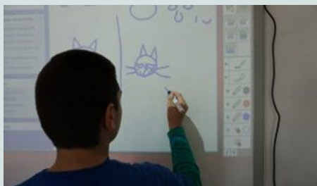
Ο διαδραστικός πίνακας στο μάθημα

Έχοντας να επιλέξετε από τρία τουλάχιστον ειδικά δημοτικά σχολεία στην περιοχή ή ακόμη και την περίπτωση της φοίτησης σε ένα γενικό σχολείο, αυτό είναι πράγματι ένα καλό ερώτημα. Η εμπειρία της φοίτησης του παιδιού σας θα ήταν κάτι που θα σας