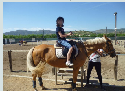
Εβδομαδιαίο πρόγραμμα θεραπευτικής ιππασίας

μεταφοράς για πιο απομακρυσμένες περιοχές. Όλα τα παραπάνω μέσα διατίθενται δωρεάν.